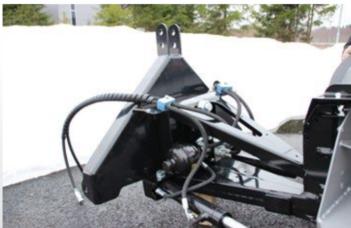
Abgebildet Dreipunktaufnahme mit Niveaueingleich