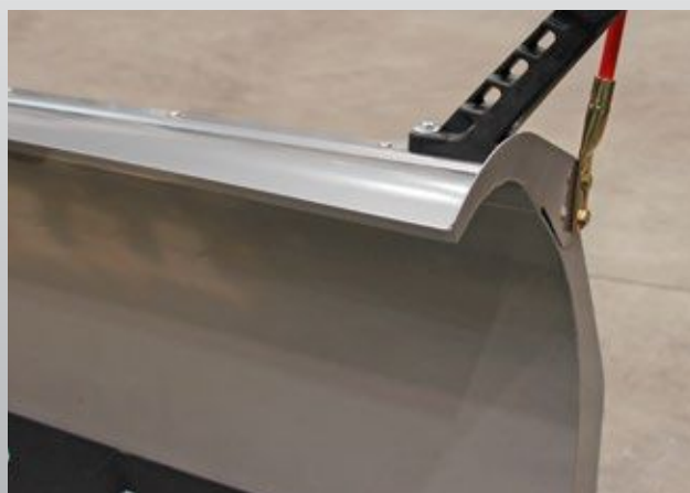
Stahl-Schneeabweiser für Gerade-Pflug (optional)