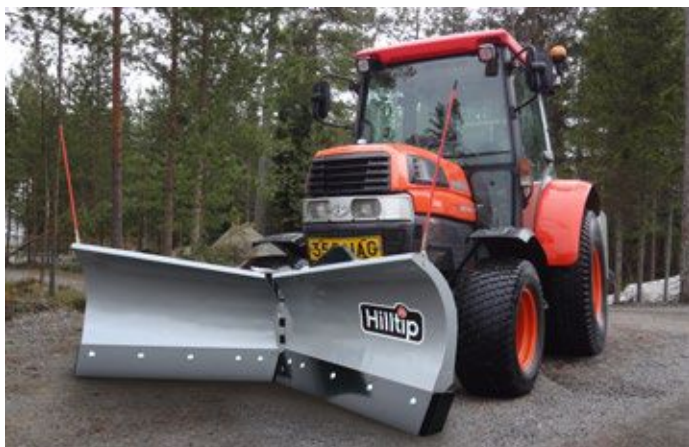
2100 VTR an Kubota Kompaktraktor